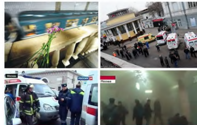
ВЗРЫВЫ НА СТАНЦИЯХ МЕТРО "ЛУБЯНКА" и "ПАРК КУЛЬТУРЫ"